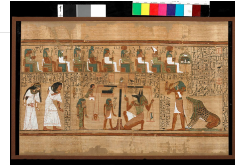
'Book of the Dead', Papyrus of Ani (frame 3): Ani's Judgment: 1250BC 頃