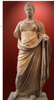
300 BC 頃